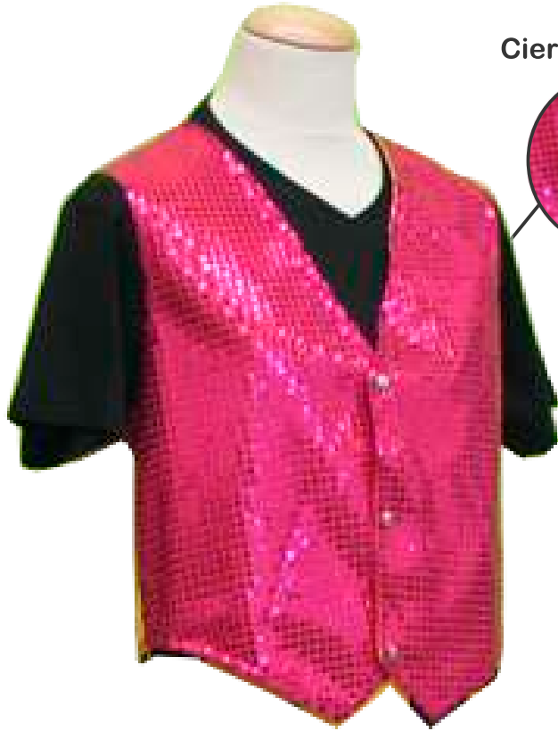
Detalle Cierre Corchetes